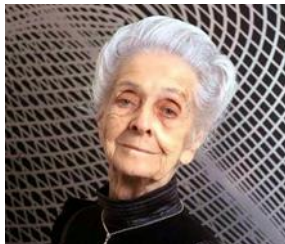
Rita Levi Montalcini