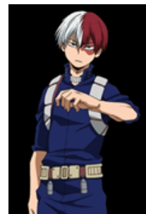
Todoroki (My hero academia)